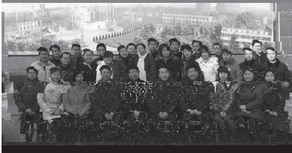
焦化厂班毕业合影：山东大学与兖州矿业集团焦化厂联合举办的山东大学成人高等教育函授班毕业学员在邹城市兖州矿业集团焦化厂合影留念。