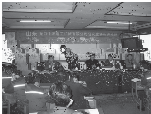
中际开班 山东大学机械工程学院与山东中际电工机械有限公司联合举办的研究生班开学典礼在龙口市的中际电工机械有限公司举行。