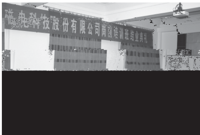
岗前培训结业：山东大学机械工程学院为山东华特磁电科技股份有限公司举办的员工岗前培训班在山东大学机械工程学院会议室举行结业典礼。

培训费为每年3000元/人，在山东大学校内脱产上课期间住宿费1200元/人（以山东大学当年收费文件为准），教材费预收500元/人，结业时多退少补。取得山东大学网络教育学籍的学员，需缴纳学费6000元（以当年物价局规定为准），按山东大学网络教育招生规定时间分两次缴纳。