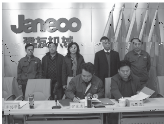
建友签约: 山东大学与山东建设机械股份有限公司联合举办研究生课程进修班签约仪式在山东建设机械股份有限公司会议室举行。